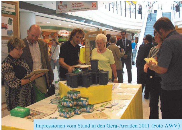
Impressionen vom Stand in den Gera-Arcaden 2011

Sind Sie gut vorbereitet? Auch das Pfingstfest wird wieder eine abfallreiche Zeit.