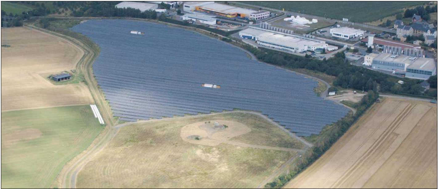
Luftbild der sanierten Deponie Greiz-Gommla (Bildmitte), im Hintergrund die mit Solarmodulen belegte Fläche.

Am 4. August 2012 war es soweit: die Solaranlage auf der stillgelegten Deponie Greiz-Gommla wurde offiziell ihrer Bestimmung übergeben. Bei einem Tag der offenen Tür standen sowohl Vertreter des AWV Ostthüringen als auch des Projektplaners und Pächters, der Windkraft Nord AG (WKN AG) Husum, den Besuchern für Fragen zur Verfügung.