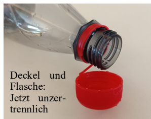
Deckel und Flasche: Jetzt unzertrennlich

Mit dem befestigten Deckel erfüllen die Hersteller die Vorgaben einer EU-Richtlinie. Diese schreibt vor, dass Einweggetränkeverpackungen aus Kunststoff Verschlüsse haben müssen, die fest mit der Verpackung verbunden bleiben. Der Grund dafür ist, dass bei Inspizierungen an europäischen Stränden am häufigsten Getränkeflaschen, Deckel und Verschlüsse gefunden wurden. Der festgebundene Deckel soll sicherstellen, dass dieser nicht verloren geht, sondern dem Recycling zugeführt wird. Ziel der EU-Richtlinie ist es, den Kunststoffmüll in der Umwelt, vor allem im Meer und an Stränden, zu reduzieren.