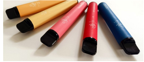
Einweg-E-Zigaretten, ugs. „Vapes“ enthalten keinen Tabak, sondern eine nikotinhalige Flüssigkeit (Liquid).

Auch wenn die E-Zigaretten teilweise so klein sind, dass sie in die Jackentasche passen, erfolgt die Entsorgung über einen Recyclinghof. Die Abgabe ist dort zu den Öffnungszeiten kostenlos möglich.