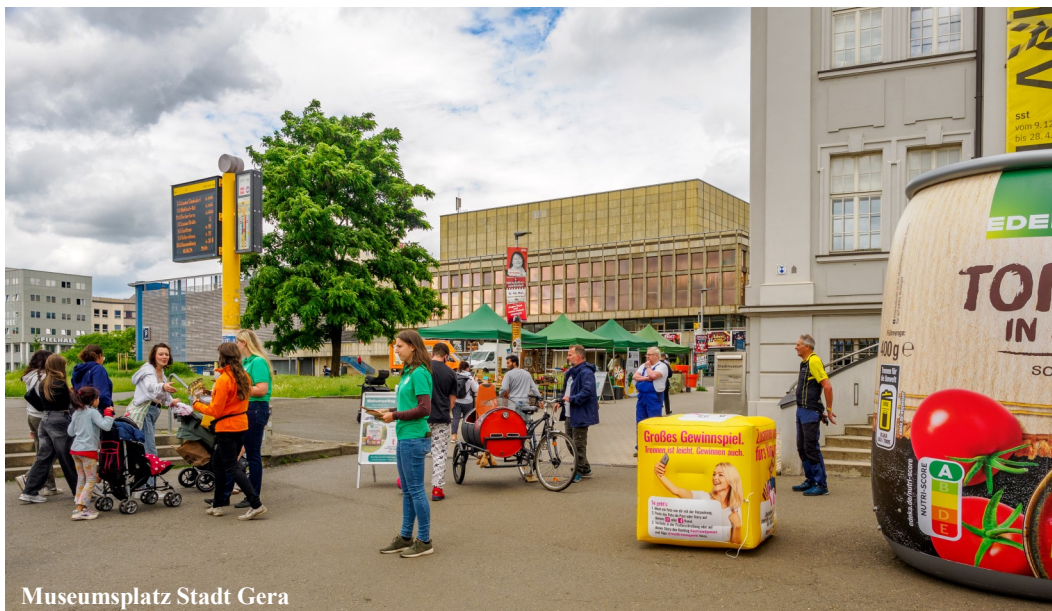
Museumsplatz Stadt Gera

Der AWW Ostthüringen beteiligte sich im Zeitraum vom 03.06.2024 bis 16.06.2024 an der bundesweiten Aktion „Deutschland trennt. Du auch?“ der Initiative „Mülltrennung wirkt“. Im Rahmen des Weltumwelttages veranstaltete der AWW am 05.06.2024 gemeinsam mit der Berndt Bio Energy GmbH, der Otegau Arbeitsförder- und Berufsbildungszentrum GmbH und dem Verein Streetwork Gera e.V. einen Aktionstag in der Geraer Innenstadt. In der darauffolgenden Woche war der AWW Ostthüringen am 14.06.2024 mit einem Aktionsstand auf dem Marktplatz in Zeulenroda-Triebes präsent. Gemeinsam mit dem „TRENNBÄR“ Maskottchen wurde auch dort über die Themen Abfallvermeidung und Mülltrennung informiert.